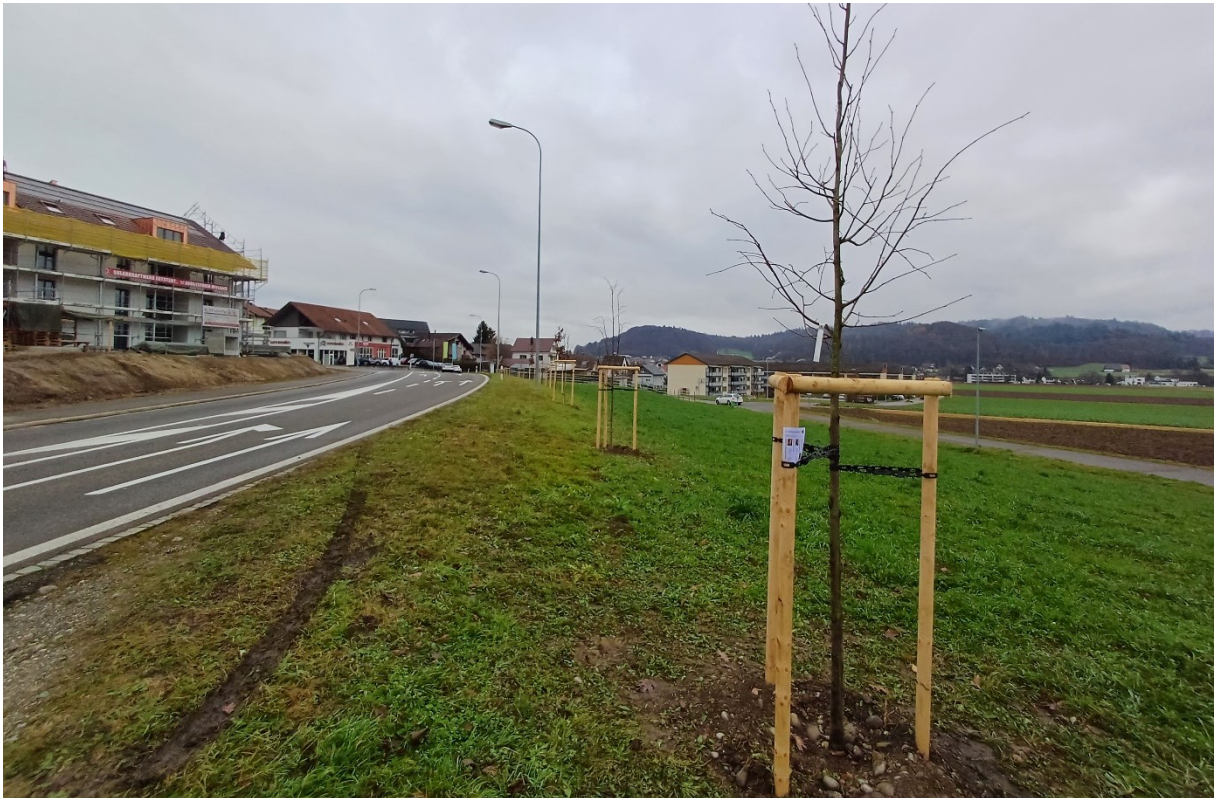
Abb. 2: Die neue Baumreihe der Lenzburgerstrasse entlang. Diverse Linden, Eichen und Waldkirschen setzen einen Akzent bei der Dorfeinfahrt.

Der Dottikerstrasse entlang stehen vier Einfamilienhäuser in Fahrtrichtung Dottikon. Hinter diesen Häusern ist eine 110 m lange Hecke gesetzt worden. Sie setzt sich zusammen aus: Schwarzem Holunder, Wolligem Schneeball, Gemeinem Schneeball, Pfaffenhütchen, Liguster, Salweiden, Traubenkirschen, Kreuzdorn, Schwarzdorn, Weissdorn, Sanddorn, Tierlibaum, Faulbaum, Sauerdorn, Hundsrose, Bereifte Rose, Felsenbirne und Schneeballbättrigem Ahorn.