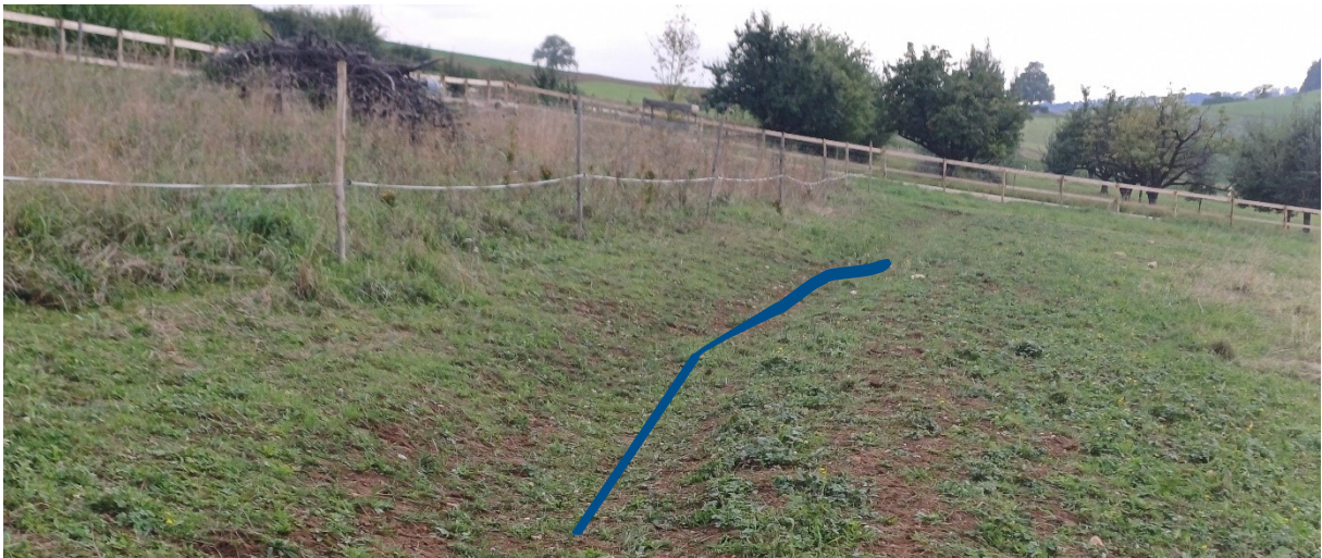
Abb.1 :Exkursion in Mandach am 27.8.2025. Blau markiert die Keyline, ein hangparalleler Graben, über den das Oberflächenwasser in einen Retentions- und Versickerungsteich geleitet wird – nach Schwammstadt-Prinzipien. Wasser verlangsamen, vor Ort versickern, verdunsten lassen oder gar für die Bewässerung nutzbar machen.