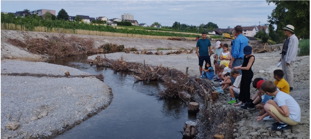
Abb. 8: Auf der Exkursion an der neu renaturierten Bünz. Dabei haben die Schüler auch Muscheln entdeckt, die leider nicht die seltene Bachmuschel ist. Doch die Freude daran ist doch gross gewesen.

Mit einer Primarschulklasse aus Dottikon ist vor und während den Bauarbeiten eine Führung der Bünz entlang gemacht worden, damit die Schüler den Bach vor und nach der Renaturierung kennen lernen.