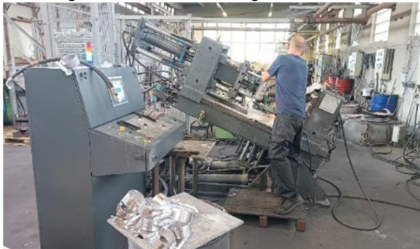
Abbildung 3: Wizol AG in Sarmenstorf