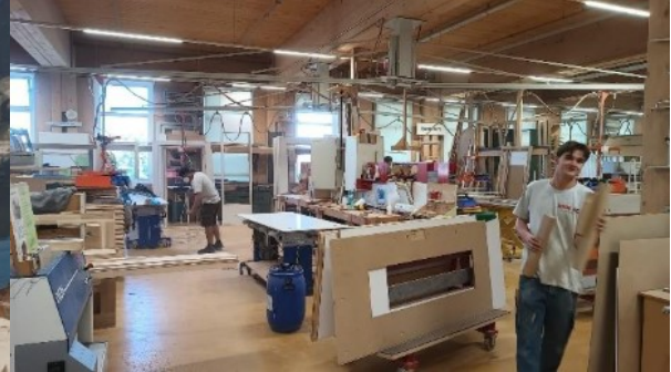
Abbildung 2: Heim AG in Waltenschwil