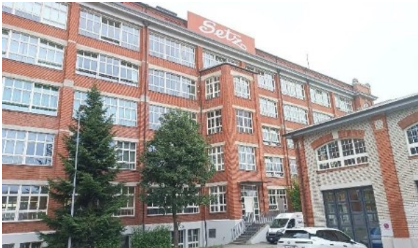
Abbildung 5: Setz AG in Dintikon