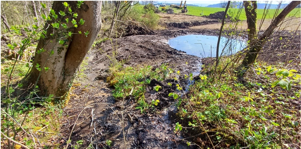
Abb. 5: Der kleine Teich beim Steinmüriweiher, nicht abgedichtet aber mit Zufluss (im Vordergrund) und Überfluss (links oben) von und zum Steinmüribach. Im Hintergrund ist die Baustelle des grossen Teiches ersichtlich.

Die zwei Teiche beim Steinmüri-Waldweiher sind auf der Landwirtschaftsseite gebaut. Der kleinere liegt im Schilf, ohne Abdichtung. Ein Teil des Steinmüribachs fliesst durch den Teich. Der Überfluss ergiesst sich zurück in den Steinmüribach und danach in den Steinmüriweiher. Der grosse Teich, ausserhalb des Schilf's, ist mit der Schlemmsand-Stabilit-Mischung abgedichtet. Bollensteine und Holzhaufen dienen als Kleinstrukturen für Amphibien und andere Kleintiere.