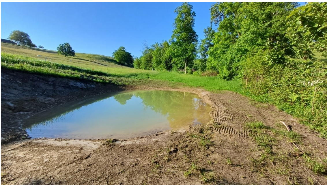
Abb. 3: Teich in der Bergmatt, kurz nach dem Bau.

Das Projekt im Nadelband ist weiter in Bearbeitung. In der Zwischenzeit ist bekannt, welche ergänzenden Angaben die Abteilungen Landwirtschaft und Bodenschutz verlangen, bevor sie dem Projekt zustimmen können.