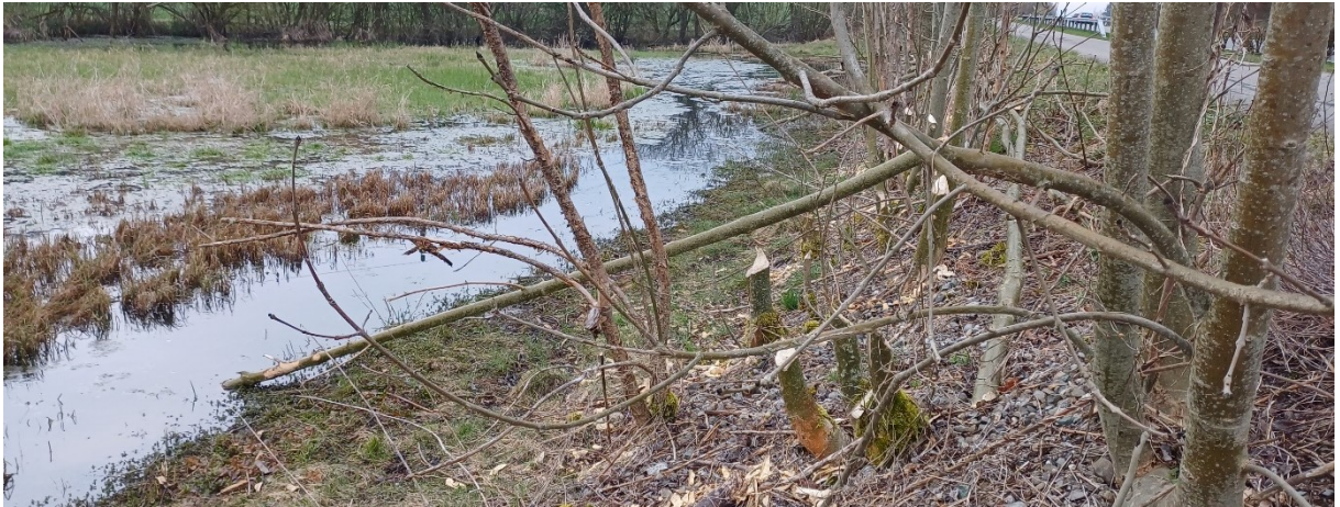
Abb. 6: Die Biberaktivitäten am Erusbach in Sarmenstorf. Der Biber ist so aktiv, dass die Gemeinde angehalten ist, ein Biberkonzept zu erstellen, um so festlegen zu können, wo die Biber wie stark ihren Gestaltungswillen ausleben lassen können.