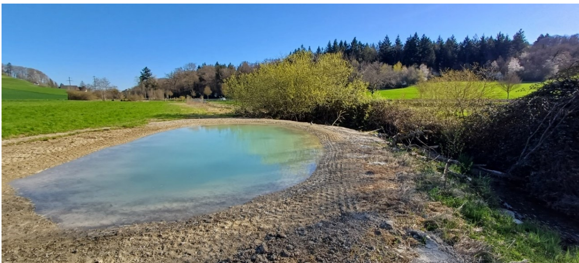
Abb. 4: Teich bei der Alten ARA, kurz nach dem Bau bevor die Kleinstrukturen aufgebaut wurden. Der Teich schmiegt sich zwischen den Erusbach und einer feuchten, artenreichen Wiese.