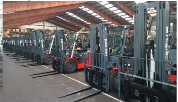
Abbildung 4: Max Urech AG in Dintikon