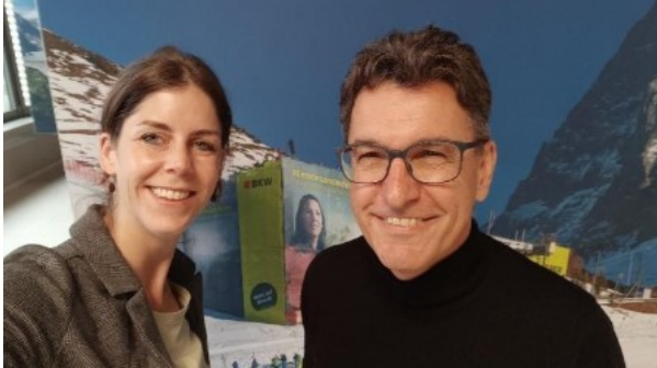
Abbildung 1: Richnerstutz in Villmergen