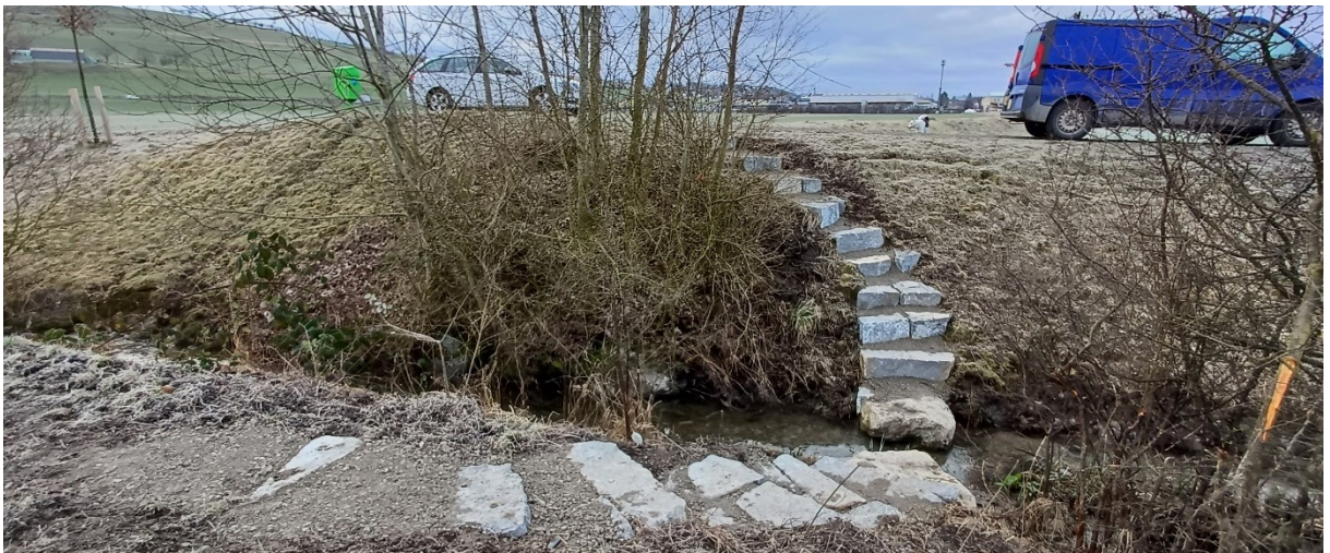
Abb. 7: Der Bühlmooskanal mit den verbindenden Stufen zwischen den zwei Wegabschnitten des ehemaligen Eisenbahndammes.

Der ehemalige Eisenbahndamm zwischen Sarmenstorf und Fahrwangen ist ein viel gegangener Spazierweg. Dieser wird an der Bauzonengrenze zu Sarmenstorf unterbrochen durch den Bühlmooskanal. Mit einigen wenigen, gesetzten Steinen ist der Bachquerung jetzt querbar.